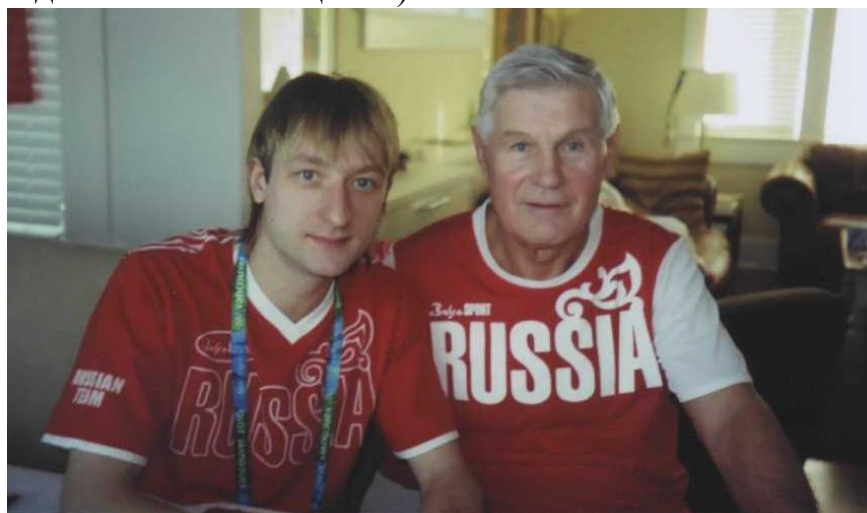
Фото 6. С олимпийским чемпионом Евгением Плющенко (фигурное катание).

Во время международных спортивных соревнований он своими руками восстанавливал здоровье элите советского и российского спорта после тяжелейших испытаний, массировал знаменитостей (от Юрия Гагарина и Майи Плисецкой до Евгения Плющенко).