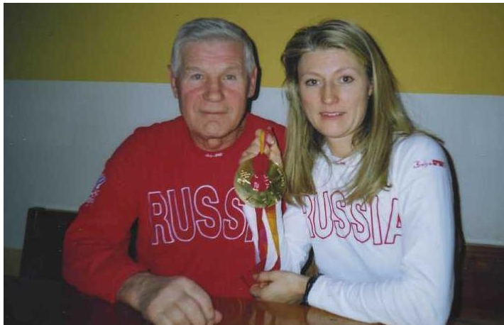
Фото 5. С олимпийской чемпионкой Светланой Журовой (конькобежный спорт).

За шестьдесят лет профессиональной деятельности у него было много ярких встреч и удивительных моментов. Он превосходно знает физическую культуру, теорию спорта, массаж, термогидропроцедуры (баня) и благодаря этому встречался со звездами спорта и выдающимися деятелями науки и искусства, с кем только не работал с Ю. Гагариным, Б. Ельциным, М. Плесецкой, Е. Кафельниковым, С. Журовой и другими. Ходил в парную с М. Жаровым, В. Высоцким, Е.Фурцевой, Л. Зыкиной, И. Родниной и многими-многими другими.