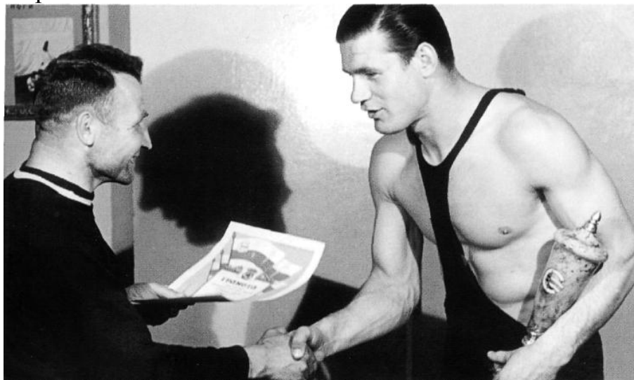
Фото 3. Награждение победителя.

борьбе занял четвертое место, стал чемпионом Москвы и «Труда» по классической борьбе.